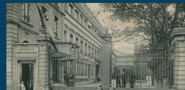
L'Arsenal de Puteaux